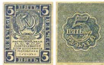
Илл. 3. Расчетный знак РСФСР номиналом в 5 руб. образца 1920 г., лицевая и оборотная стороны