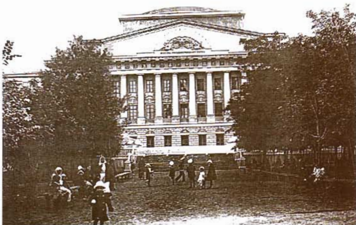
Илл. 1. Ростовская-на-Дону контора Госбанка, в стенах которой с 1917 по 1921 г. было организовано изготовление денег. Фото 1916 г.