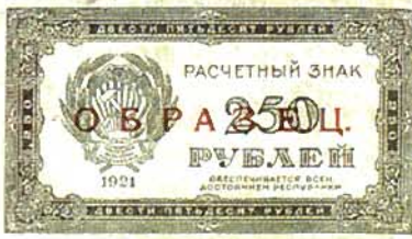
Илл. 5. Расчетный знак РСФСР образца 1921 г. номиналом в 250 руб., лицевая сторона