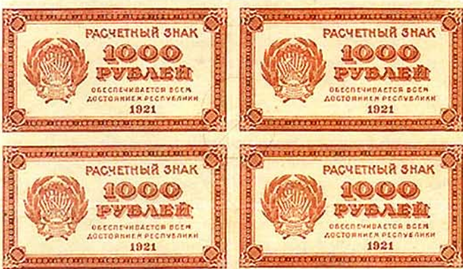
Илл. 7. Расчетный знак РСФСР образца 1921 г. номиналом в 1000 руб., лицевая сторона

наименование, обозначение достоинства. Формат одинаковый — 80 x 44 мм по рамке. Расчетные знаки номиналами в 250, 500 и 1000 руб. образца 1921 г. выпускались листами по 20 шт. в листе (5 x 4). Бумага для печати использовалась с водяным знаком, который был выполнен в виде цифры номинала по всему полю. Именно на эти, так сказать, технические параметры банкнот, как выяснится позже в ходе следствия, и обратили внимание ростовские фальшивомонетчики, разрабатывая план ограбления фабрики. Оказывается, и в 1920—1921-е гг. прошлого века тысячная купюра была в обращении самой ходовой. И, не имея практически никакой защиты, кроме бумаги с водяным знаком, она, конечно, представляла лакомый кусок для злоумышленников. Чем они и не преминули воспользоваться! Но подробнее об этом мы расскажем чуть позже.