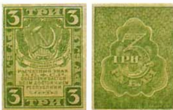
Илл. 2. Расчетный знак РСФСР номиналом в 3 руб. образца 1920 г., лицевая и оборотная стороны

В ноябре 1921 г. Ростовская фабрика Гознака в связи с бешеной инфляцией, вызванной Гражданской войной, разрухой и, не в последнюю очередь, политикой военного коммунизма, предполагавшей разрушение денежного обращения вплоть до окончательного уничтожения денег, перешла к выпуску расчетных знаков образца 1921 г. высоких номиналов – в 250, 500, 1000, 25 000 и 50 000 руб. Стоит отметить, что знаки в 250, 500 и 1000 руб. также имели упрощенное исполнение. На них не