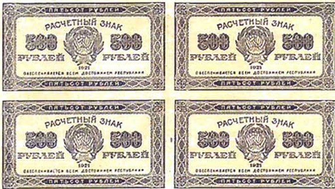
Илл. 6. Расчетный знак РСФСР образца 1921 г. номиналом в 500 руб., лицевая сторона