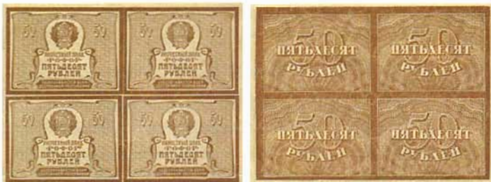
Илл. 4. Расчетный знак РСФСР номиналом в 50 руб. образца 1920 г., лицевая и оборотная стороны