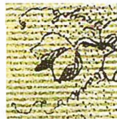
Ил. 6. Микронодуси И. Новикова

Лонские денежные знаки, несмотря на то что производились в сложных ус- ловиях (Гражданская война), имели до- статочно надежную защиту. У них был