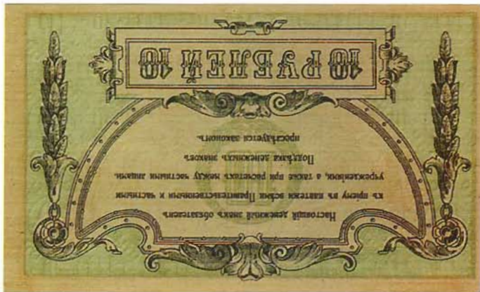
Ил. 2. Ростовская Комтора Государственного Банка. 10 рублей

Однако изготовление местных кредитных билетов, тормовившихся по многим техническим причинам (прежде всего, из-за отсутствия специальной бумаги с водяными знаками), невозможно было осуществить в намеченном масштабе ранее февраля 1918 г. Через некоторое время официальное название «Экспедиция по Изготовлению Денежных Бланков» было переименовано на другое – «Экспедиция по Изготовлению Денежных Знаков» (далее – ЭИДЗ).