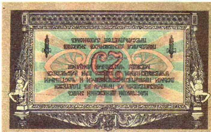
Ил. 10. Ростовская Комтора Государственного Банка. 25 рублей, без водяных знаков