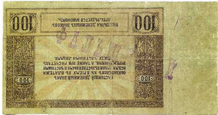
Ил. 9. Фальшивый денежный знак Ростовской Комторы государственного банка номиналом в 100 рублей