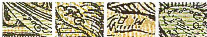
Ил. 5. Микронодуси гравера М. Давыдова

Все лонские денежные знаки отли- чались размерами рисунка прописи как лицевой, так и оборотной сторон. Осо- бенно сильно они различались на 5-руб- левых купюрах, порой — до 3 м. Цвето- вые оттенки также были непосто- янны. Это объяснялось использованием см разных красок, а также их смешива- нием в процессе печатания.