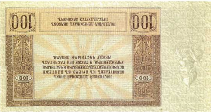
Ил. 8. Ростовская Комтора государственного банка. 100 рублей, без водяного знака