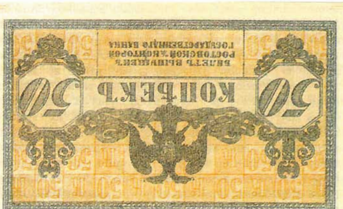
Ил. 4. Ростовская Комтора Государственного Банка. 50 копеек