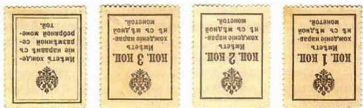
Ил. 2. «Марки-деньги» (оборотная сторона)