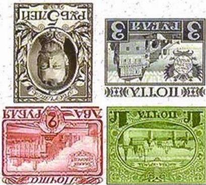
Ил. 3. «Юбилейные» почтовые марки

При рассмотрении рисунков «юбилейных» почтовых марок в 1, 2, 3 и 5 руб. пригодными к выпущку оказались рублевая, двух и трехрублевая, содержащая изображение исторических зданий; на рублевой — Кремль, на двухрублевой — Зимний дворец, на трехрублевой — Палаты бояр Романовых. В виде детали оформления применялся старый государственный герб. На пятирублевой марке был изображен портрет бывшего императора Николая II, которого большевики к тому времени уже успели расстрелять вместе со всей семьей. В виду этого марка номиналом в 5 руб. была забракована. Марки печатались металлографским способом, что давало им идеальную защиту от подделки. Однако это обстоятельство, являлось для данных марок и крупным минусом, так как все