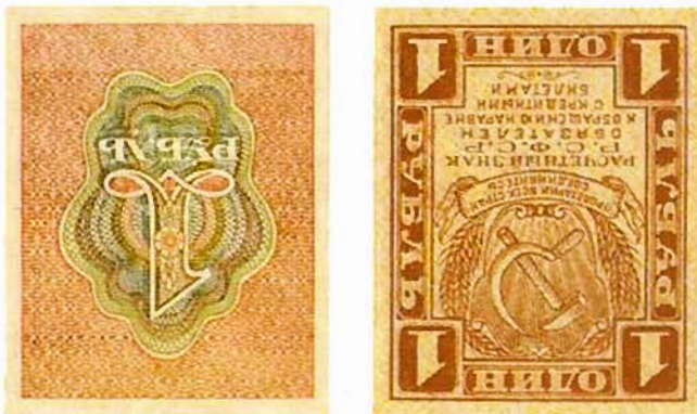
Ил. 7. Расчетный знак РСФСР упрощенного типа образца 1919 г. номиналом в 1 руб.