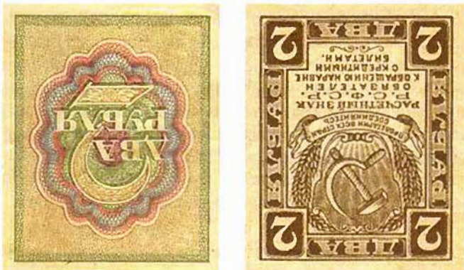
Ил. 8. Расчетный знак РСФСР упрощенного типа образца 1919 г. номиналом в 2 руб.

16 ноября 1918 г. управляющим Экспедицией было составлено Особое Совещание, по вопросу о срочном выпуске в обращение казначейских денежных знаков номиналом в 1, 2 и 3 руб. марочного типа. Особое Совещание пришло к решению немедленно приступить к изготовлению рисунков марок всех указанных достоинств в окончательной редакции, внося в несказанные изменения в отношении: а) надписи «Государственный расчетный знак Российской Социалистической Федерации Советской Республики»; б) слова «имеют обращение» — словами «обязателен к обращению»; в) последние четыре строчки текста лицевой стороны марки нарисовать более крупным шрифтом, уменьшив для этого изображение государственного герба; г) увеличить размер верхних, по углам цифр, определяющих достоинство марки.