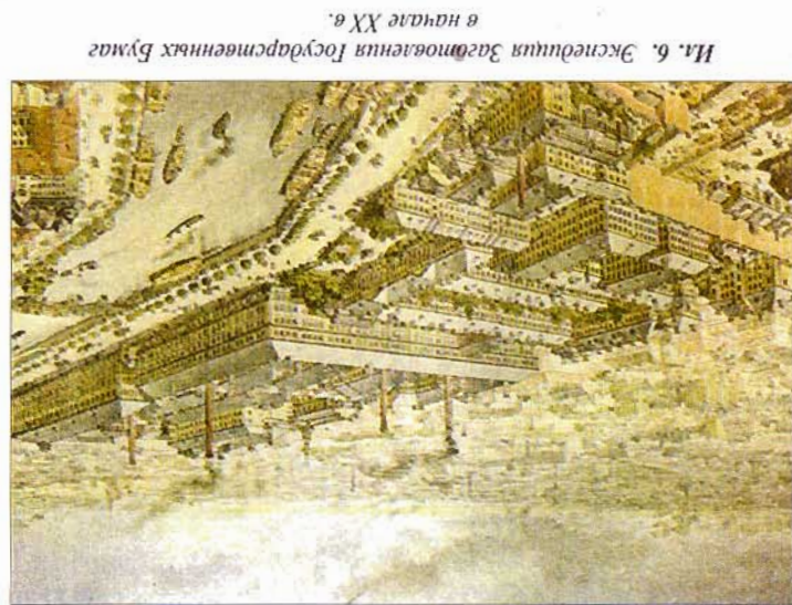
Ил. 6. Экспедиция Государственных Бумажных Дел в начале XX в.

Это предложение встретило полное одобрение администрации Экспедиции, в стенах которой и спроектировали такую марки. По всей вероятности, он был выработан Художественным Р. Л. Заринным, ставшим с 21 мая 1917 г. главным техником по художественной части в ЭЗБ. Было решено печатать двустороннюю марку: на лицевой стороне