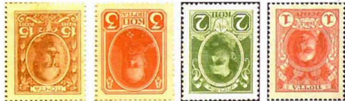
Ил. 1. «Марки-деньги» (лицевая сторона)